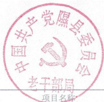
隰县预算部门（单位）项目支出绩效目标申报表 (2021 年度)