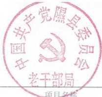
隰县预算部门(单位)项目支出绩效目标申报表 (2021 年度)